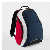
French Navy/Classic Red/White