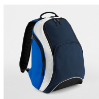
French Navy/Bright Royal/White